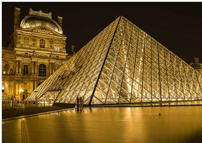
(Puigdomenech M, 2017)

Tant qu'au tourisme, on verra que grâce à ses très belles constructions, comme la tour Eiffel, l'Arc du Triomphe et ses rues, Paris est la destination romantique par excellence.