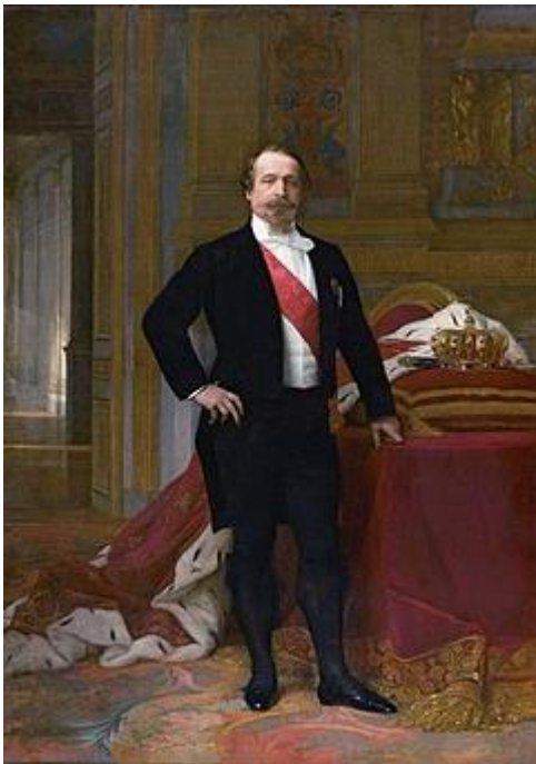
Napoléon III Portrait d'Alexandre Cabanel, vers 1865

Des tendances telles que le positivisme et le scientisme sont nées, grâce aux avancées technologiques qui ont commencé à cette époque grâce à la deuxième révolution industrielle