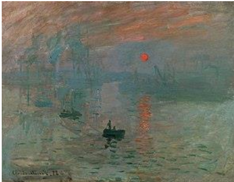
Soleil levant 1872