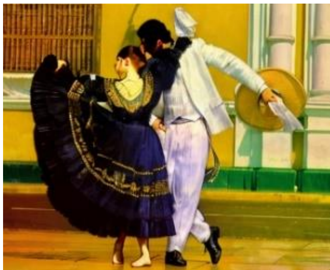
Marinera, une danse typiquement péruvienne.

Cette danse s'appelle : Marinera, c'est une danse typique et cette image est une représentation de la manière dont le célèbre artiste français Edgar Degas aurait peint cette belle danse de notre pays.