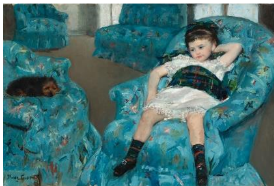
Petite fille dans un fauteuil bleu, huile sur toile de Mary Cassatt, 1878