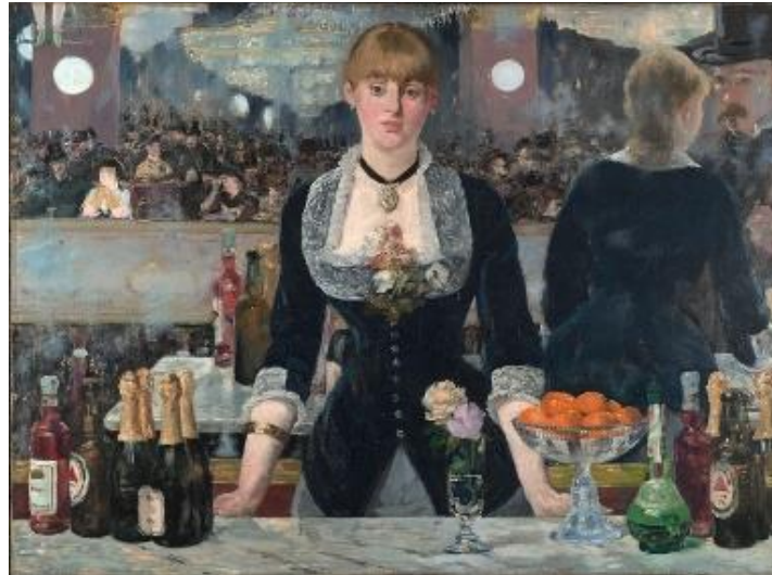
Un bar aux Folies-Bergère par Édouard Manet, 1882