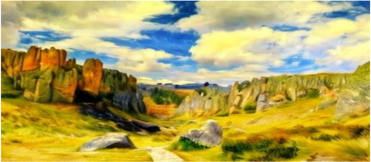
Cumbemayo, un aqueduc construit par les Incas. Image adaptée par les élèves à l'aide de ressources d'édition

Ce lieu s'appelle "Cumbemayo", c'est un paysage très populaire dans ma ville. Cumbemayo ressemblerait ainsi en utilisant le style impressionniste de l'artiste français Auguste Renoir.