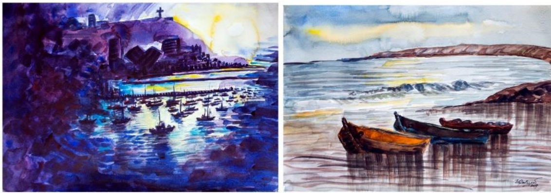
Chorrillos : entre l'histoire et les mythes de Teófilo Castillo

Dans l'exposition "Chorrillos : entre histoire et mythes", la couleur est subjective et arbitraire, exprimant la sensibilité de l'artiste dans l'auto-reconnaissance du lieu. Les formes des paysages sont héritières de la tradition de la peinture péruvienne symboliste ou d'avant-garde.