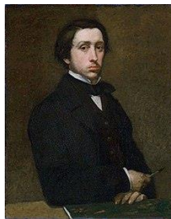
Edgar Degas, 1834-1917