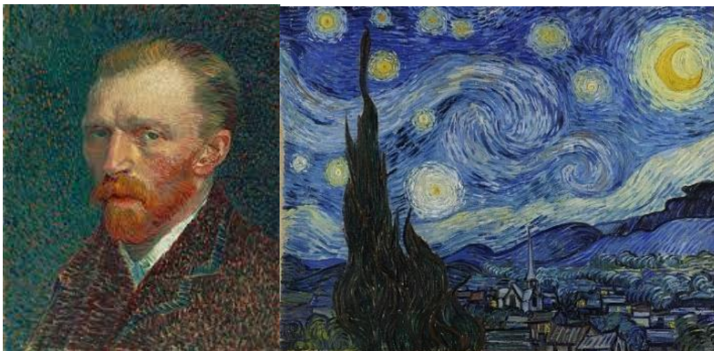
Vincent van Gogh - 1853-1890. La nuit étoilée, huile sur toile de Vincent van Gogh, 1889.