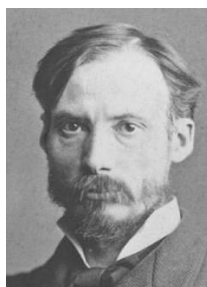
Auguste Renoir 1841-1919

Auguste Renoir était connu pour ses paysages magnifiques et ses jeux de lumière. Le Pérou est une terre de paysages époustouflants, des Andes majestueuses à la côte spectaculaire en passant par la jungle luxuriante. Un artiste péruvien, inspiré par Renoir, pourrait utiliser la palette impressionniste pour représenter la beauté naturelle diversifiée du pays, capturant ainsi la lumière changeante sur les montagnes, les océans ou encore les forêts.