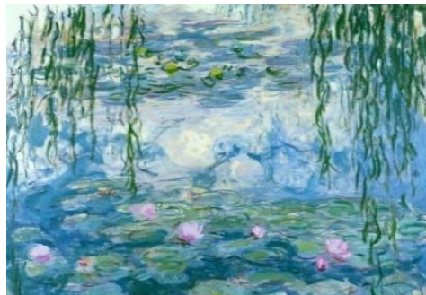
Les Nymphéas de Claude Monet

Le mouvement impressionniste a encouragé la diversité et la créativité dans l'art, incitant les artistes péruviens à s'exprimer librement.