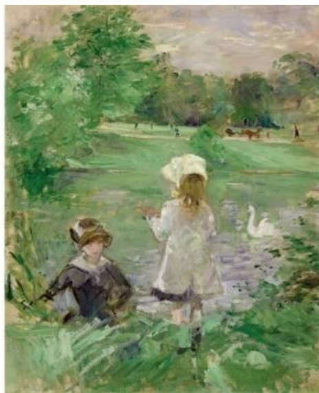
Au bord d'un lac 1883 - Berthe Morisot