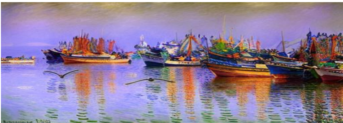
Bateaux et pêcheurs sur la côte péruvienne. Image adaptée par les élèves à l'aide de ressources d'édition d'images.