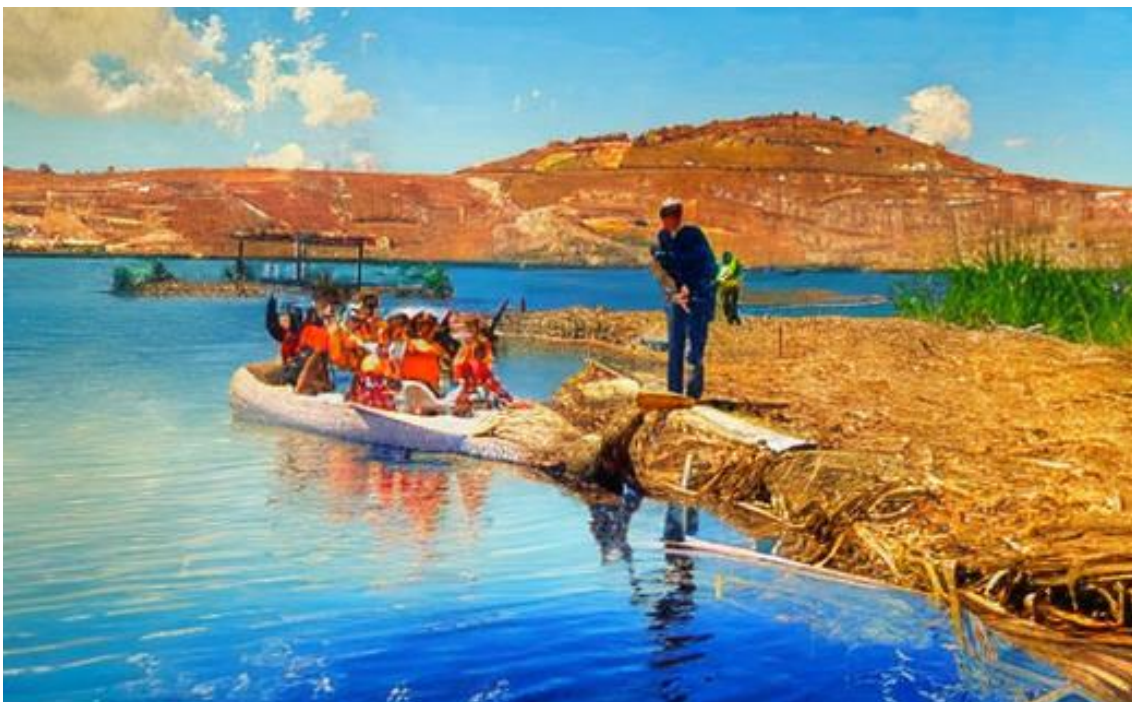
Laguna de San Nicolás, Cajamarca. Image adaptée par les élèves à l'aide de ressources d'édition d'images.