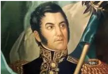
Don José de San Martín

Les idées de la Révolution française ont également influencé les mouvements indépendantistes d'Amérique latine au XIXe siècle, avec des dirigeants comme Simón Bolívar et José de San Martín qui ont promu la liberté et l'égalité dans leurs luttes pour l'indépendance.